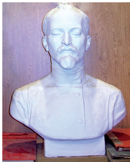
Адрес: город Челябинск, улица К. Маркса, 78 Бюст установлен в музее Центрального отдела полиции Управления МВД по г. Челябинску.