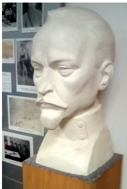
Адрес: город Челябинск, улица Либединского, дом 41 Бюст установлен в музее Центра профессиональной подготовки главного Управления МВД по Челябинской области.